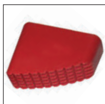
Leiterschuh, rot für Leitertypen 1900/1800